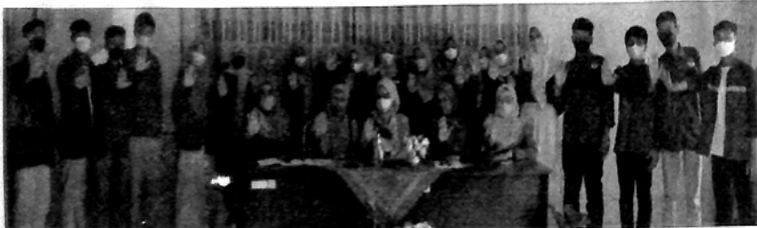
CAPACITY Building Forum Anak Kota, Kecamatan dan Kelurahan se-Kota Padangpanjang di LBK Silaing Bawah, Kecamatan Padangpanjang Barat.