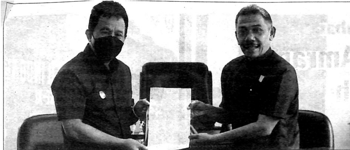
Ketua Pansus HJK Agam dan Wakil Walikota Padang Panjang