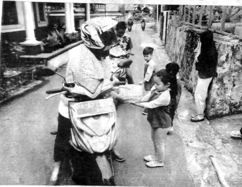
SISWA PAUD Permata Ibu memberikan pabukoan kepada pengendara yang melewati PAUD Permata Ibu.

"Kita imbau kepada masyarakat, agar pelaksanaan takbiran nantinya bisa dilaksanakan masing-masing masjid, tidak ada takbiran keliling" tambah Sonny. (dit)