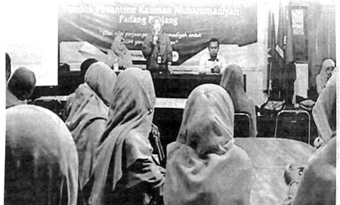
MUDIR Pontren Kauman Padangpanjang Derliana ketika membuka kegiatan Baitul Arqam Muhammadiyah bagi Tenaga Pendidikan dan Kependidikan di Pontren Kauman.

"Tujuan kegiatan BAM ini adalah untuk meningkatkan pemahaman keislaman, menciptakan kesamaan dan kesatuan sikap, integritas, wawasan dan cara berpikir di kalangan anggota penyertaan dalam melaksanakan misi Muhammadiyah. Sehingga cita-cita Muhammadiyah melalui amal usahanya dapat dicapai dengan semestinya," tuturnya. (ned)