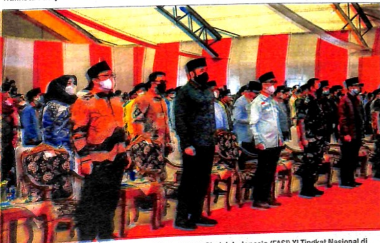
Walikota Fadly hadir pada pembukaan Festival Anak Sholeh Indonesia (FASI) XI Tingkat Nasional di Palembang